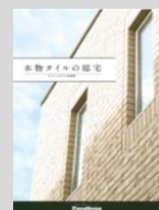
④本物タイルの邸宅