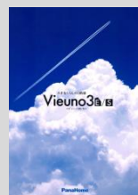
①新商品カタログ 「ビューノ3E」