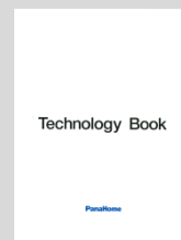
③テクノロジーブック