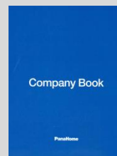
②カンパニーブック